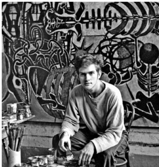
Erró nei primi anni '60

I suoi viaggi nelle vertigini dell' accumulazione passano così attraverso le più diverse esperienze della cultura arcaica e di quella contemporanea: antropologia, storia, mito, politica, scienza. Il suo universo fatto di immagini stupefacenti, terribili e insieme divertenti e gioiose, sembra nascere dalla profonda convinzione di non poter creare immagini nuove senza attingere contemporaneamente a due fonti: quella dell'io più profondo e quella della società.