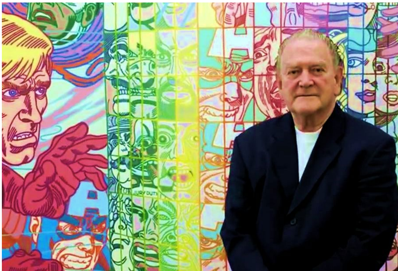
Erró in un'immagine recente