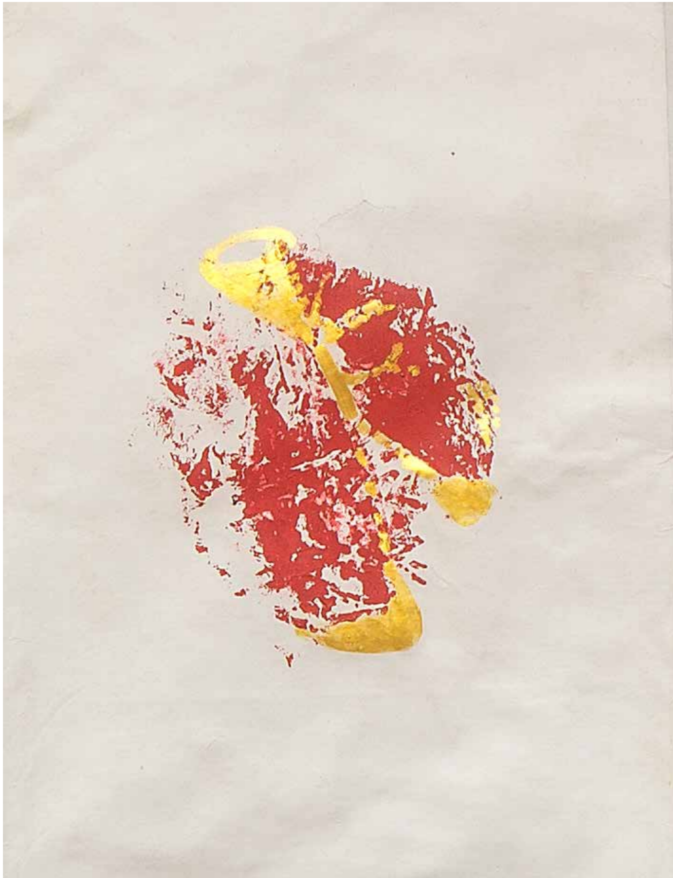
Anatomy pic nic particolare 3. 42x30 cm 2019