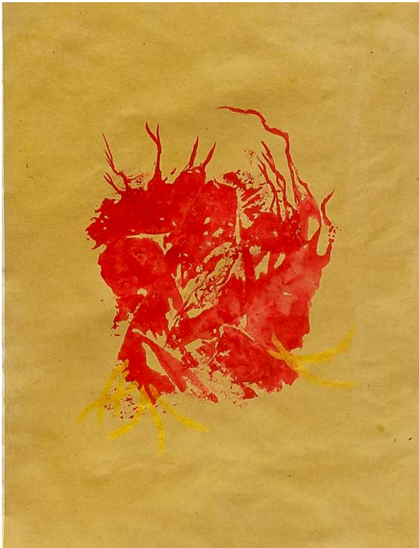
Anatomy picnic particolare 1. 42x30 cm 2019