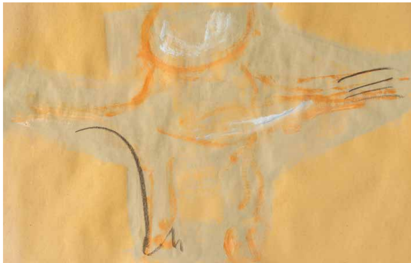
Volo 4 pastello a olio su carta. 30x42 cm 2023