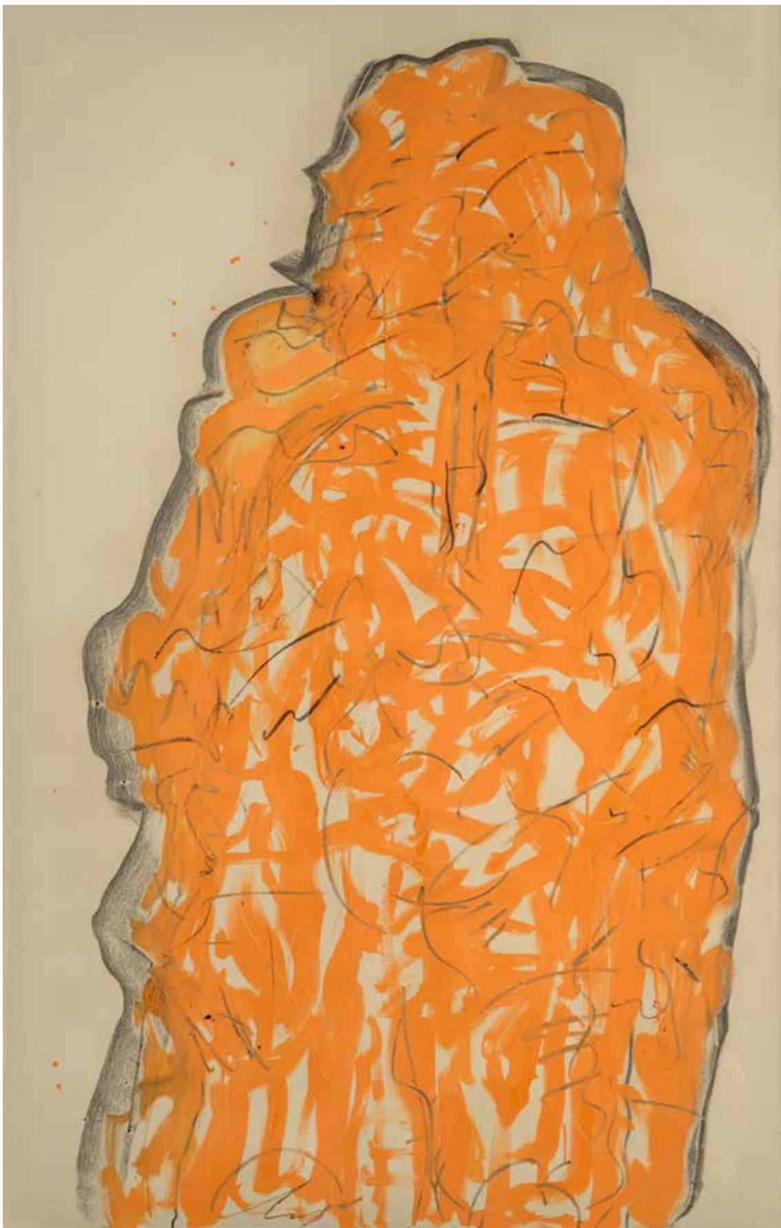
Ombra 5 acrilico e fusaggine su carta intelata. 160x100 cm 2023

Le ombre e l'anima sono il mistero del corpo