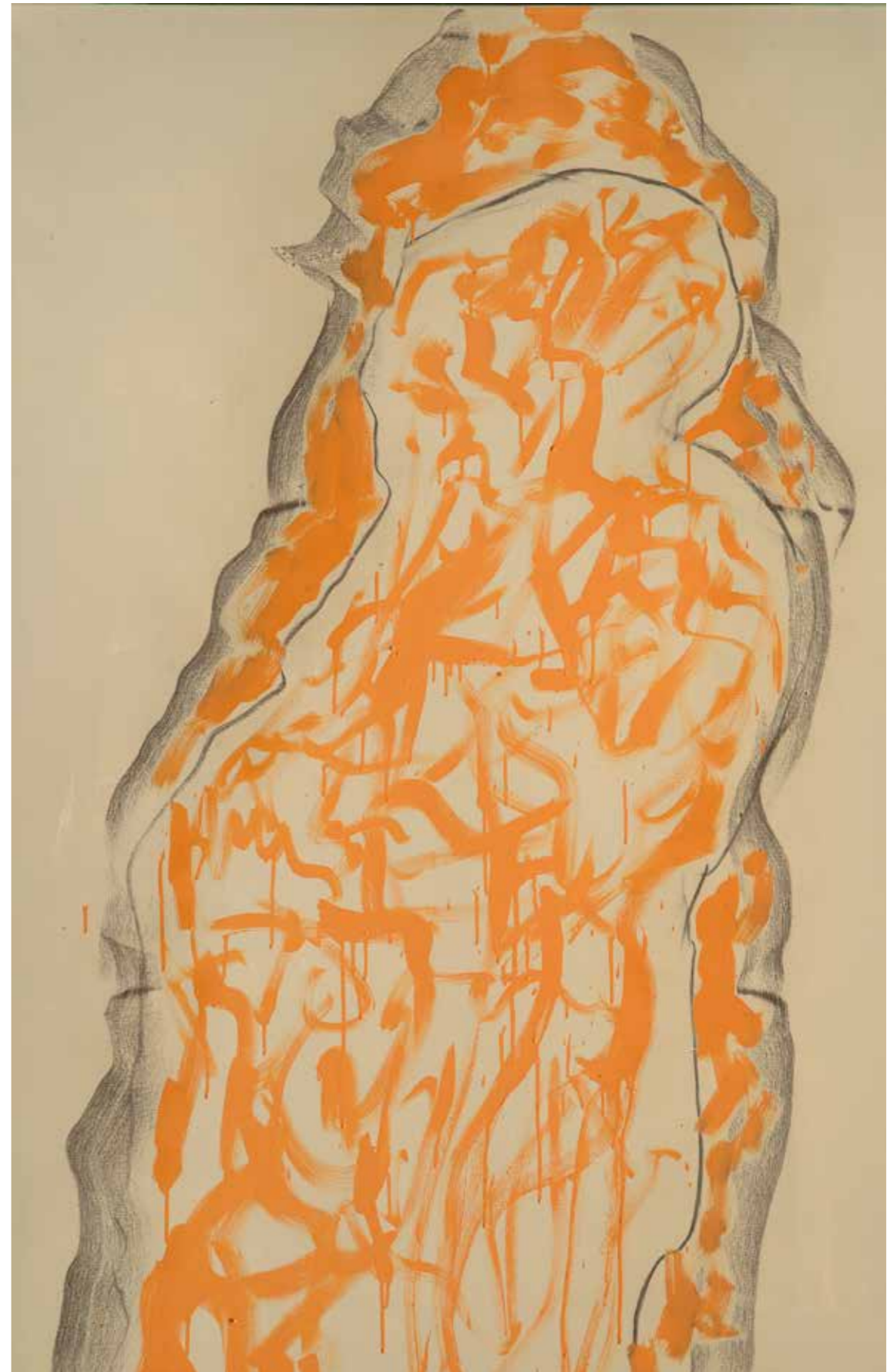
Ombra 6 acrilico e fusaggine su carta intelata. 160x100 cm 2023

Nei sogni inquieti le ombre non stanno ferme