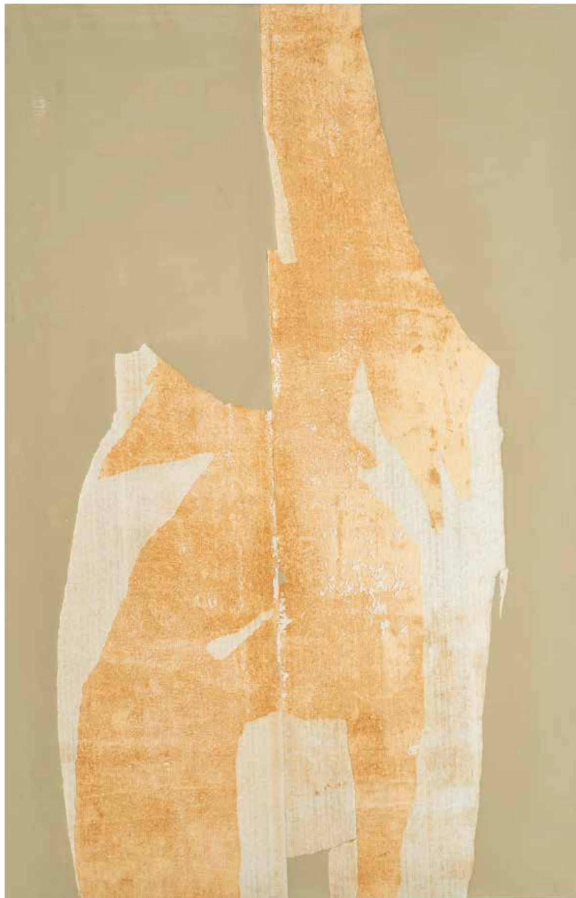
Impronta 1 acrilico su tela, colla da parati. 100x80 cm 2023

Chi si sente si aspetta per perfetto improbabili