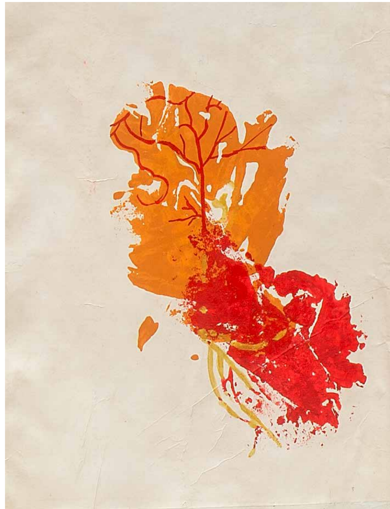
Anatomy picnic particolare 2. 42x30 cm 2019