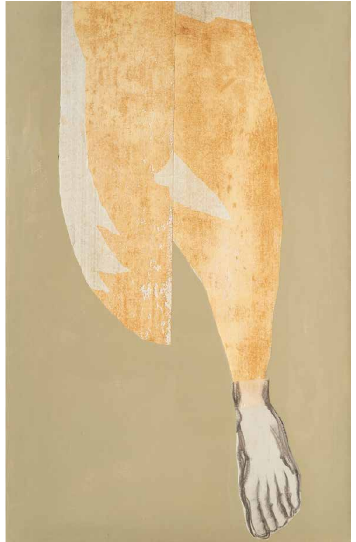
Impronta 2 acrilico su tela, fusaggine e colla da parati. 100x80 cm 2023