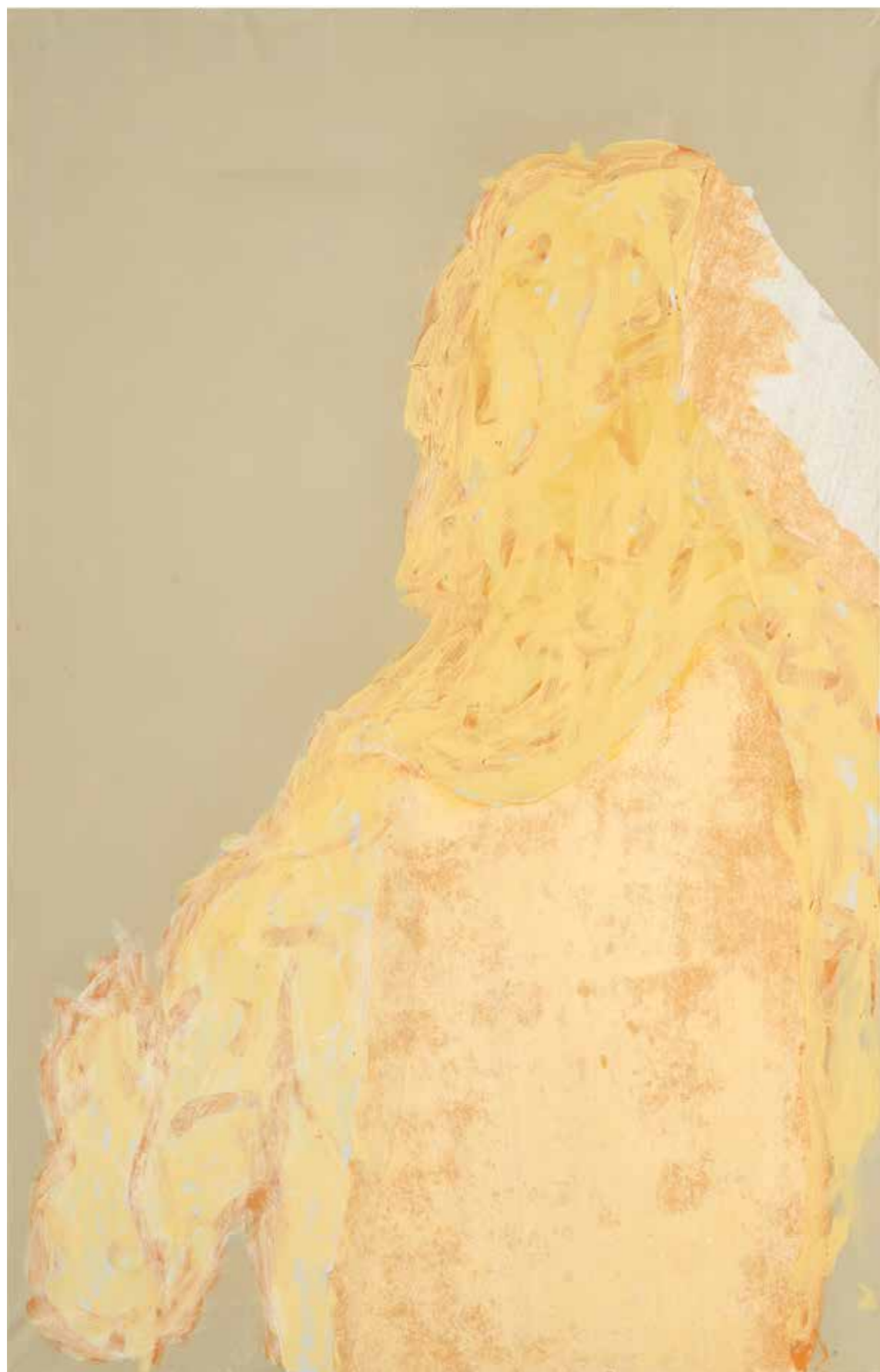
Impronta 3 acrilico su tela, colla da parati. 100x80 cm 2023

Gli specchi felici non lasciano impronte