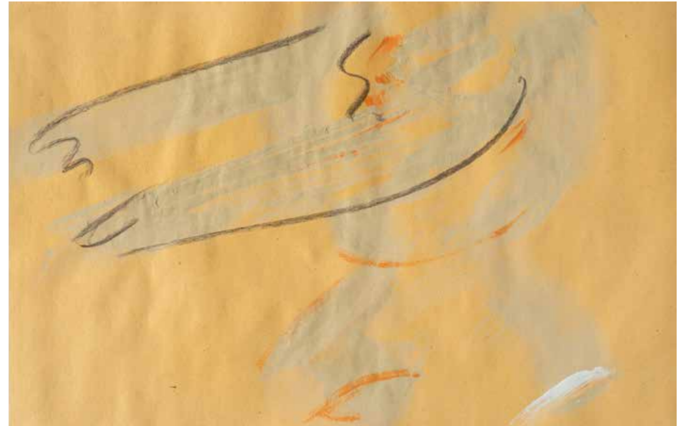
Volo 1 pastello a olio su carta. 30x42cm 2023