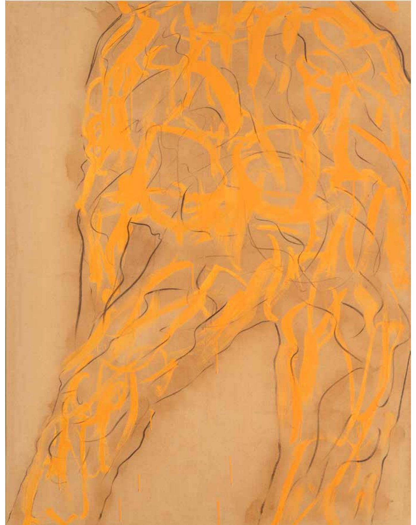
Ombra 2 acrilico e fusaggine su carta intelata. 130x100 cm 2023