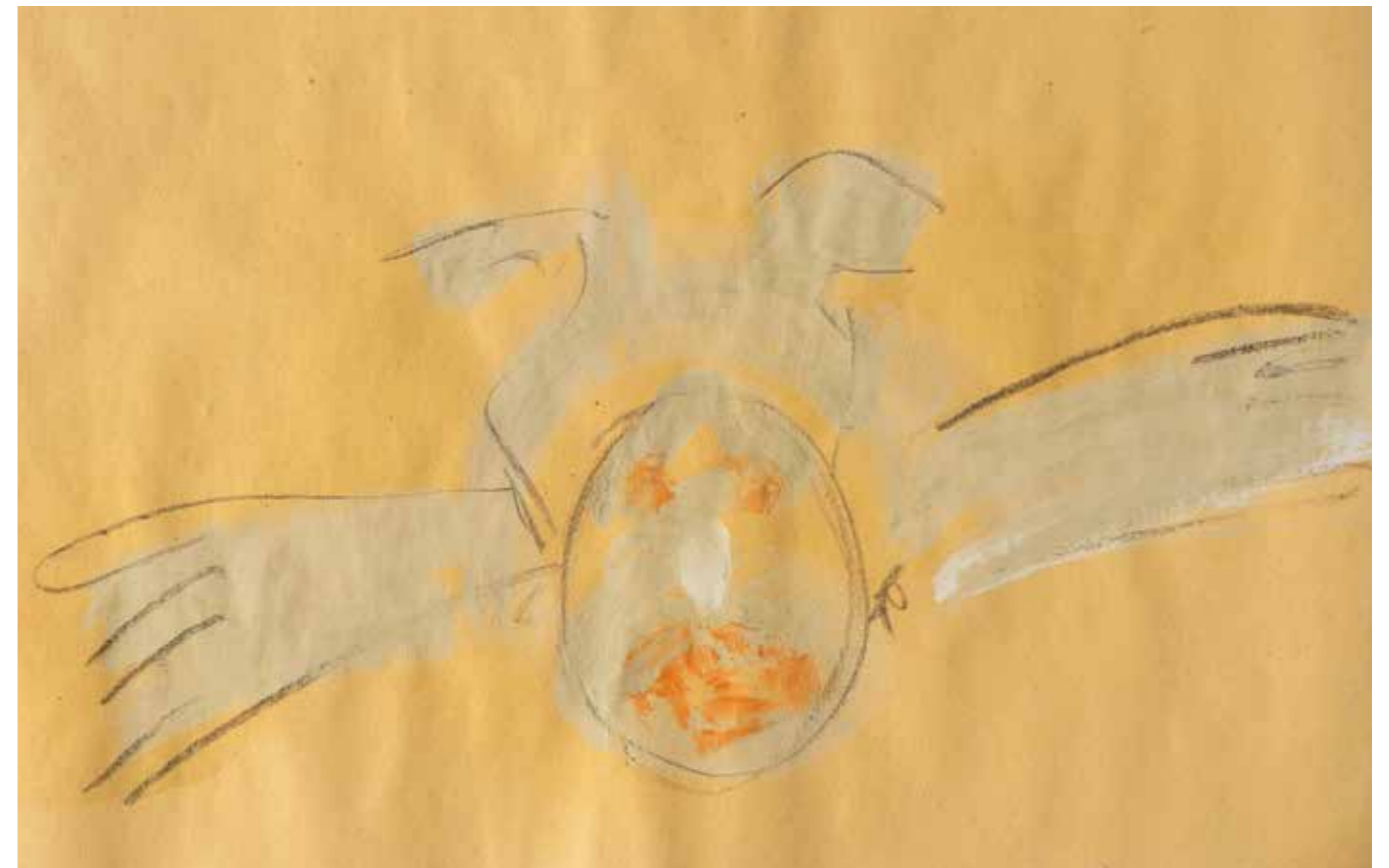
Volo 2 pastello a olio su carta. 30x42cm 2023