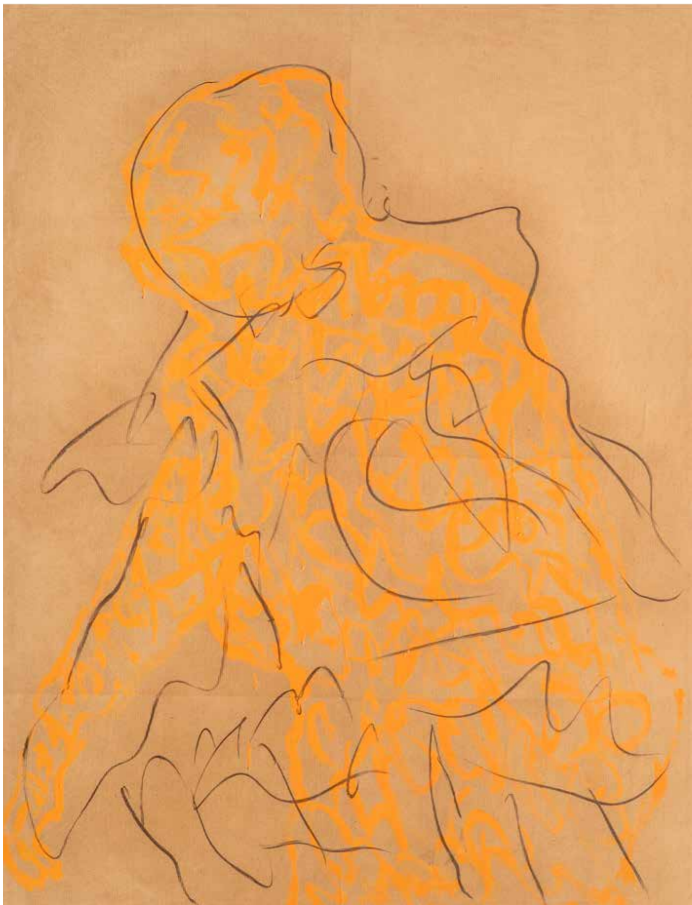
Ombra 3 acrilico e fusaggine su carta intelata. 130x100 cm 2023