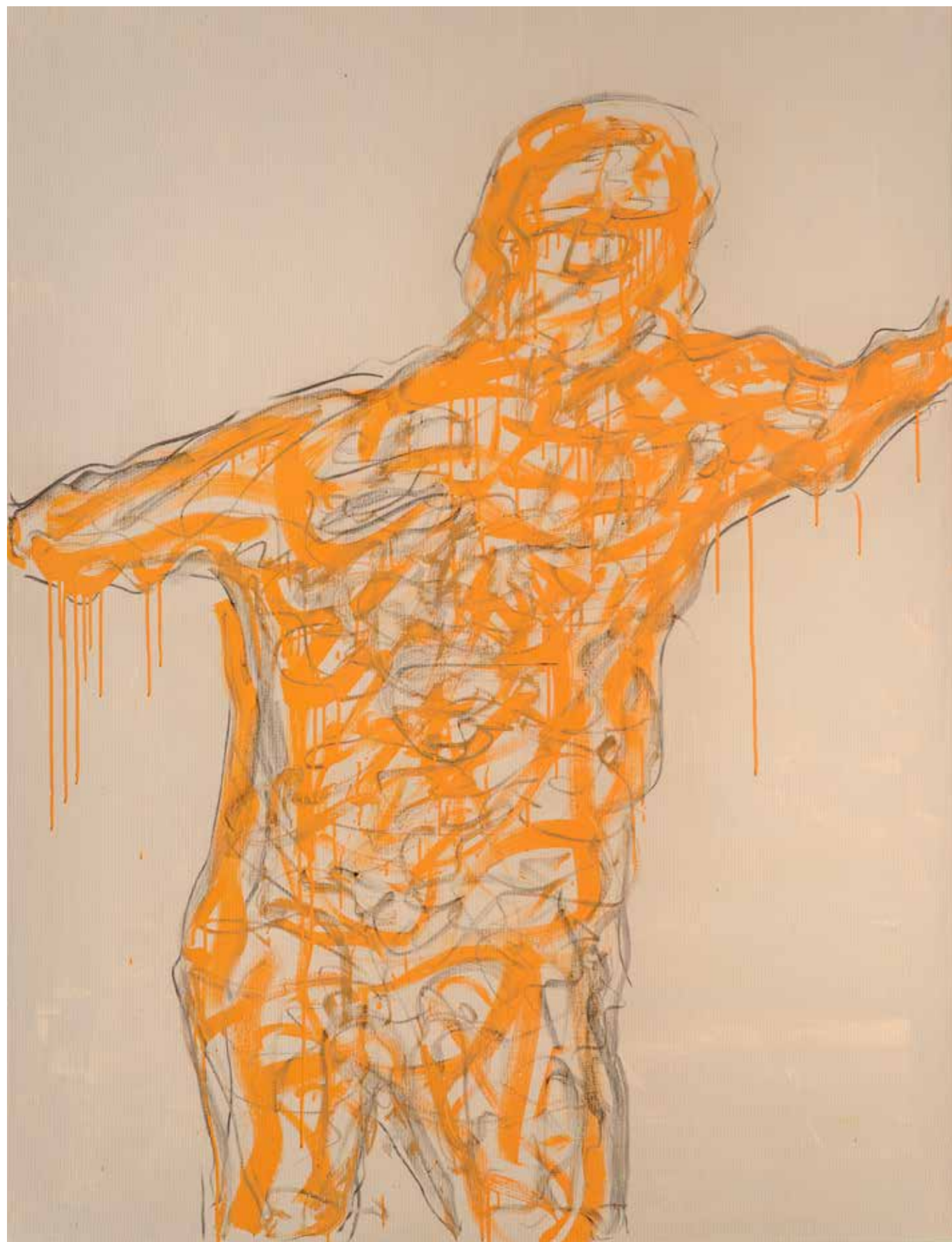
Ombra 7 acrilico e fusaggine su carta intelata. 160x120 cm 2023

Da anni ascolto solo chi è incomprensibile