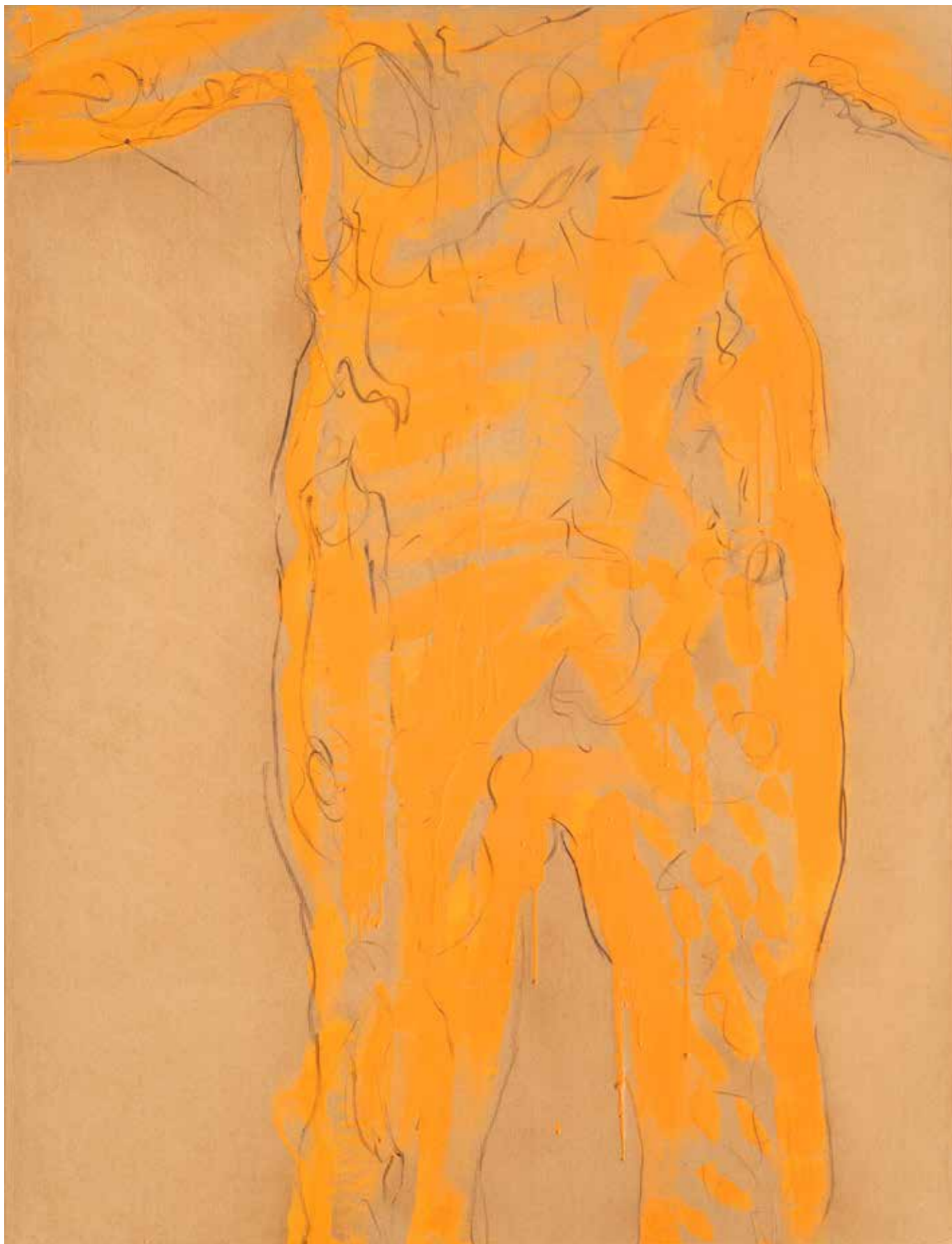
Ombra 1 acrilico e fusaggine su carta intelata. 130x100 cm 2023