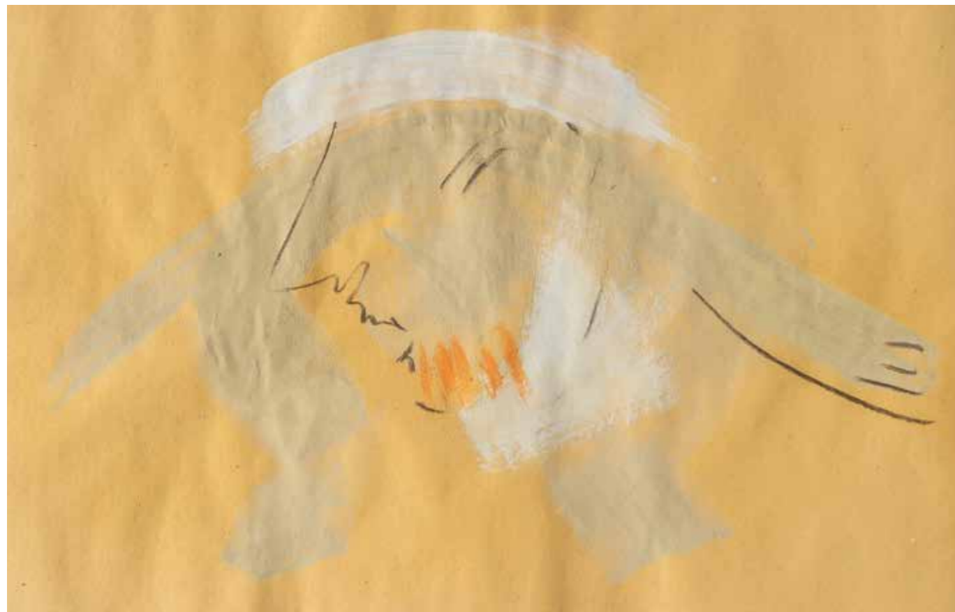
Volo 3 pastello a olio su carta. 30x42cm 2023