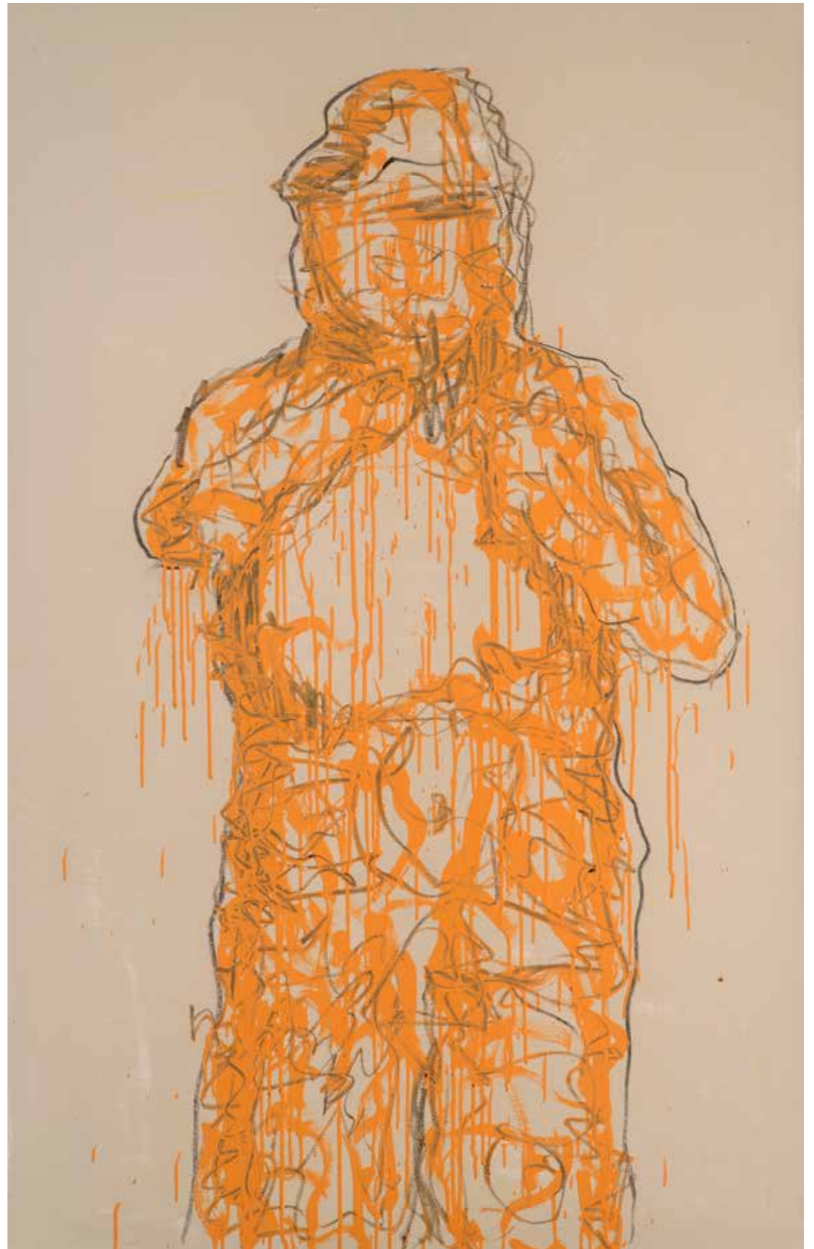
Ombra 8 acrilico e fusaggine su carta intelata. 160x100 cm 2023