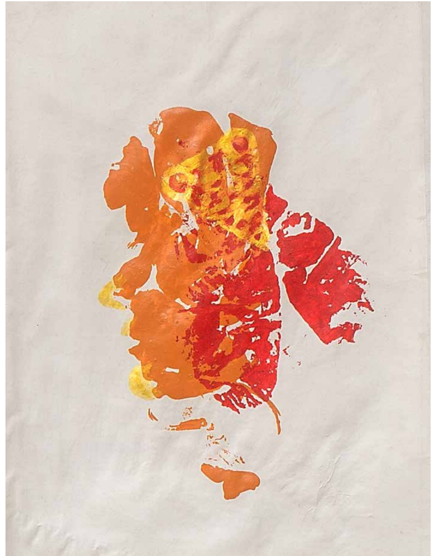
Anatomy pic nic particolare 4. 42x30 cm 2019